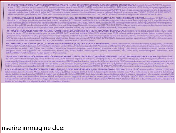
Inserire immagine due: