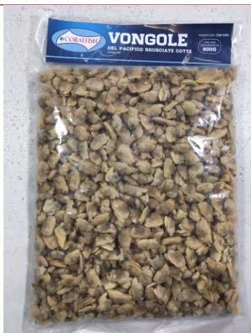
Inserire immagine uno:

Il prodotto non deve essere consumato e riportato in Punto Vendita