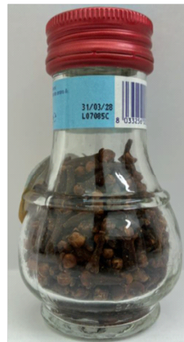
Inserire immagine due: