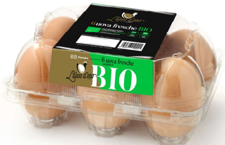
Inserire immagine uno:

RESTITUIRE LE UOVA AL PUNTO VENDITA DOVE SONO STATE ACQUISTATE