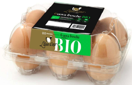
Inserire immagine due: