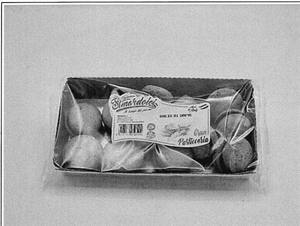
Inserire immagine uno:

In via cautelativa si chiede di non consumare il prodotto e riportare la merce presso il punto di acquisto.