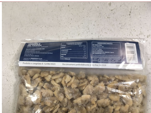
Inserire immagine due: