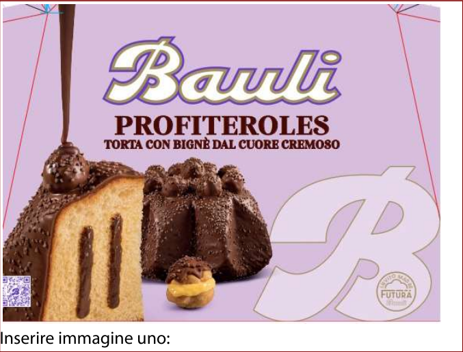
Inserire immagine uno:

Avvertenze: SI RACCOMANDA DI NON CONSUMARE IL PRODOTTO E DI RICONSEGNARLO AL PUNTO VENDITA DI ACQUISTO.