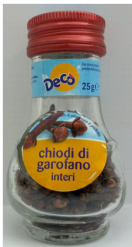
Inserire immagine uno:

Non consumare il prodotto e restituirlo al punto vendita.